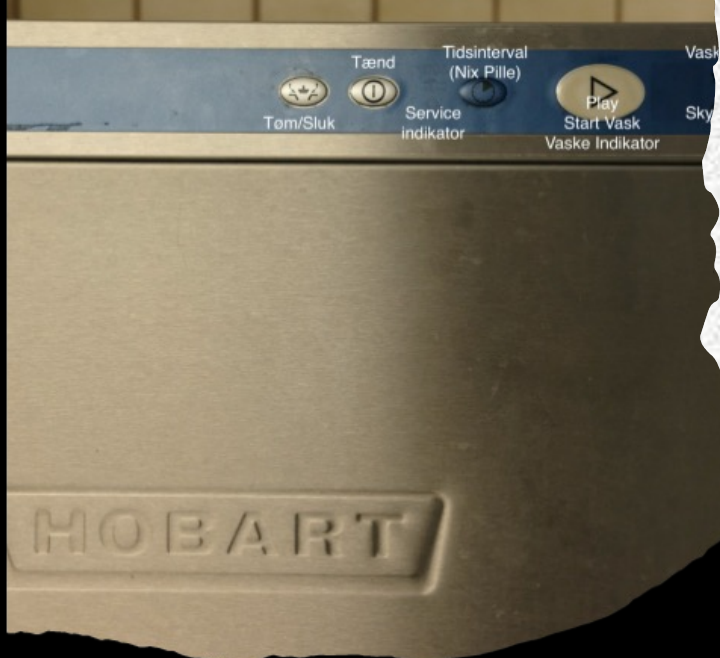
Opvaskemaskinens display består af 4 trykfunktioner